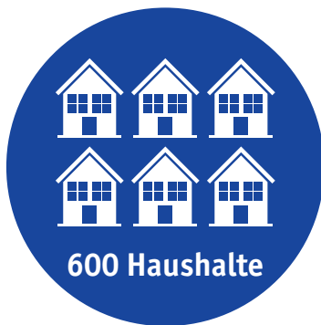
Nachhaltige Nutzung der Abwärme: 93 % CO 2 -neutrale Heizenergie für die Region Rheinfelden.

So viel Energie und Emissionen sparen wir ein