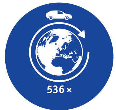
Vergleichbarer CO 2 -Ausstoss mit Fahrzeug (130 g CO 2 /km).